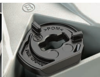
Construction en polymère et conception verrouillable de qualité supérieure