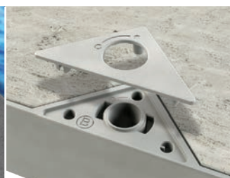
Coupe à clipser pour une finition impeccable