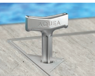
Clé en métal moulé sous pression durable

Idéal pour les nouvelles constructions et les projets de rénovation. Disponible en profondeur de 1-1/4" pour s'adapter aux incrustations de pierre et de porcelaine.