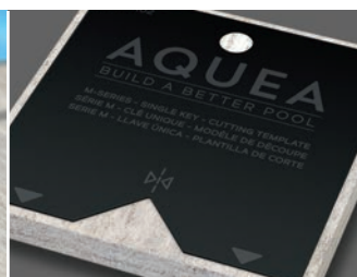
Gabarit de découpe pour une installation facile