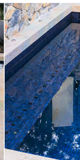
Finition soignée et discrète à l'intérieur de la piscine